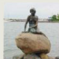
Den lille havfrue